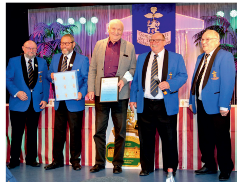
Urkunde und Sektpräsent für Ha-Di...