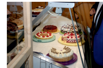
....Kaffee und Kuchen.