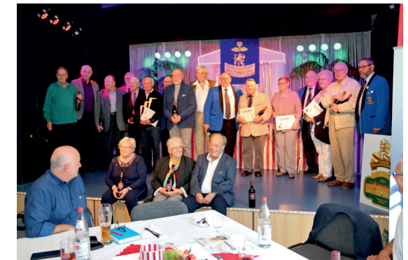
...alle anwesenden Erzträger...