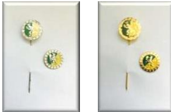
Ehrennadeln (Silber und Gold)