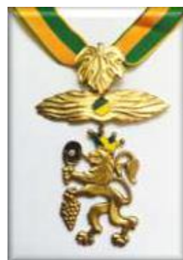
Goldener Löwe mit Brillant