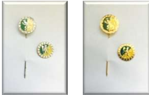
Ehrennadeln (Silber und Gold)