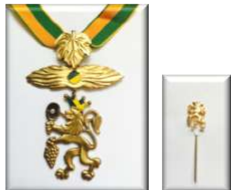
Goldener Löwe mit Brillanten